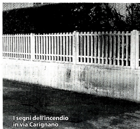
I segni dell'incendio in via Carignano