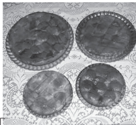
La golosa timballa

CIGLIANO. ( r.b. - m.st. ) E' ormai alle porte la manifestazione "Dolce Settembre a Cigliano". Il primo appuntamento è per sabato 5, quando corso Re Umberto e corso Gabriele D'Annunzio saranno chiusi al traffico, permettendo l'area pedonale nella zona. Negozi aperti dalle 20 in poi e bar con dehors per consumare i dolci tipici di Cigliano. Attivo anche il Banco di beneficenza della "Banca del Tempo", mentre sarà possibile cenare con i piatti tipici ciglianesi presso i ristoranti su prenotazione al costo di 18 euro. Alle 21 parata e spettacolo per le vie di corsi per la rassegna "Teatri di confine". Il concorso "Miss Timballa e Mister Canestrello" partirà invece alle 23, nelle categorie: per Lei, dolcezza - morbidezza - giocosità - delicatezza, mentre per Lui, signorilità - atipicità - portamento. I vincitori, riceveranno: per Lei, una fascia da Miss Timballa,