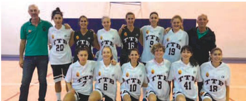
Il T.T.B. Pino di serie C femminile. In alto il collinare Corrocher

In avvio di gara a fare la differenza era la freschezza del