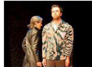
● «I will survive» il 27 all'Araldo

Domenica 27. È invece particolare l'appuntamento che Assemblea Teatro ha organizzato a Rivalta,