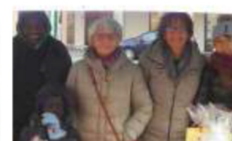
Gli scout del gruppo Oleggio 2, l'associazione Tecneke, e alcune volontarie della Banca del tempo; sotto l'oratorio di San Giovanni e quello di Loreto