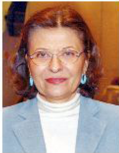
Sveva Casati Modignani

Una delle firme più amate della narrativa contemporanea, i cui romanzi, tradotti in ben venti Paesi, hanno venduto quasi dieci milioni di copie, sarà ospite venerdì 17 febbraio a Cigliano. Sveva Casati Modignani presenterà al pubblico le sue ultime opere, «Un amore di marito» e «Mister Gregory», due romanzi che nella varietà e ricchezza delle trame prendono spunto da una realtà familiare, con ambientazioni, personaggi e sfondi riconoscibili. Dietro allo pseudonimo di Sveva Casati Modignani si sono celati Bice