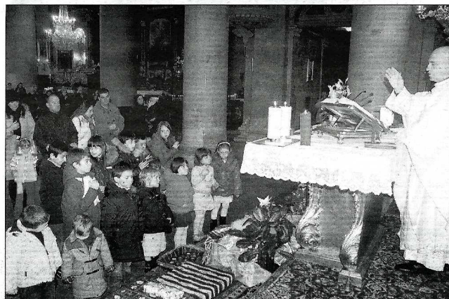
La benedizione delle famiglie e dei doni offerti

La festa della Sacra Famiglia, il Battesimo di Gesù e il Natale dei bimbi