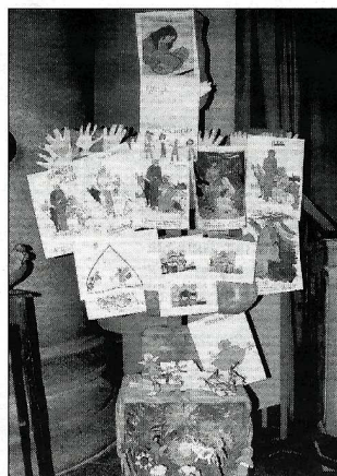
Il piccolo presepe dei bimbi con l'albero dei "pensieri a Gesù bambino"

La festa del battesimo del Signore chiude il tempo liturgico di Natale che è ricco di gioiosi momenti significativi ai quali la parrocchia di Oleggio cerca di dare il giusto risalto perché venga compreso il loro messaggio.