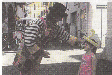
Un momento di animazione

Soddisfazione per l'affluenza di clienti. Anche chi sta in "periferia" ha potuto farsi conoscere