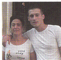
"Zucchi e Bassetti"