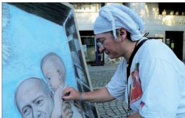
Non mancheranno gli artisti di strada...

Accanto alla mostra mercato compariranno moltissimi eventi collaterali, collegati anzitutto alla carta, ma senza esaurirsi in tale ambito. Il festival d'arte varia com-