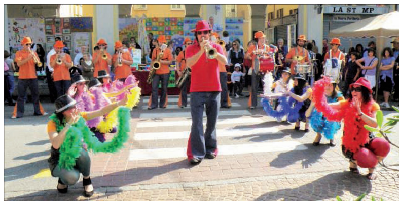
La Desperados Show Band