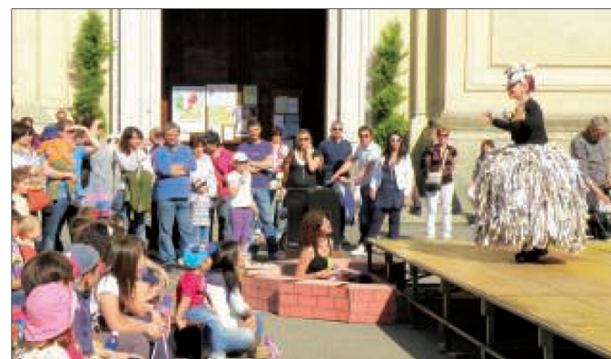
...e gli spettacoli in piazza