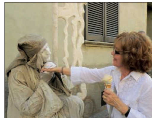
Statue viventi ed altre attrazioni