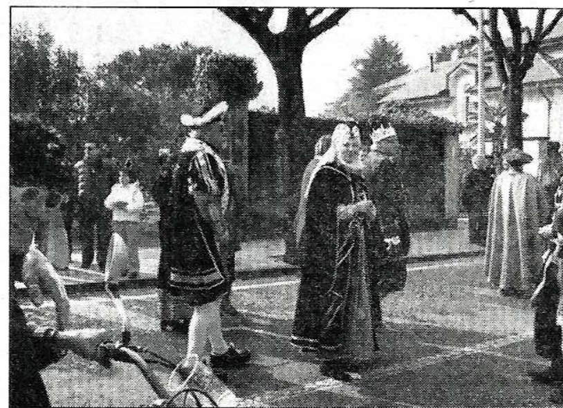
La sfilata del carnevale cannobiese

Come era nelle previsioni anche quest'anno il carnevale ambrosiano di Cannobio ha richiamato moltissime persone provenienti anche dai paesi vicini del Vco e del Canton Ticino.