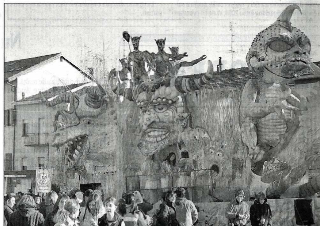
Uno dei carri partecipanti alla sfilata