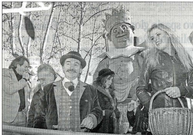
Re Carnevale “controlla” il Pirin e Veridiana

di Davide Pangallo