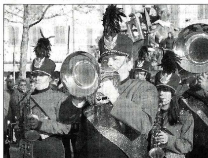
Il gruppo “Red Marching Show Band”