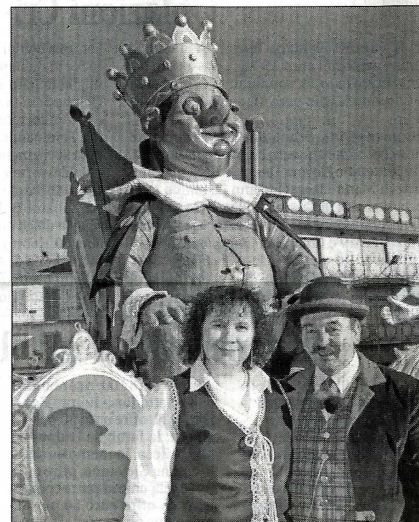
Il Pirin e la Main

Martedì 24 invece ci saranno gli appuntamenti a chiusura del Carnevale. Alle 14,30 la palestra