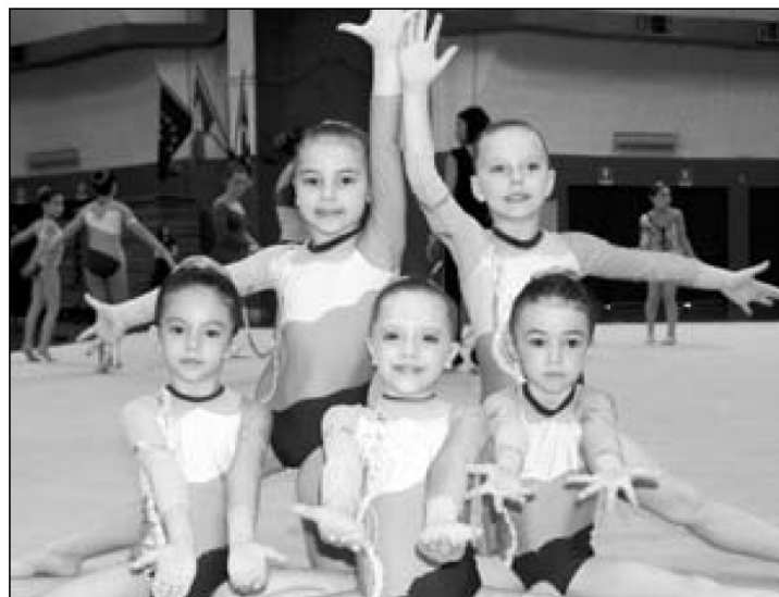
La squadra "Pulcine"

Dopo i successi ottenuti lo scorso 24 marzo, continuano le conquiste delle atlete della Asd Ginnastica Oleggio chiudendo con un bottino di medaglie la giornata del 5 maggio al palazzetto "Le Cupole" di Torino impegnandosi nella Gara Regionale di Ginnastica Ritmica.