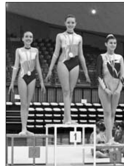
Il podio delle "Junior"