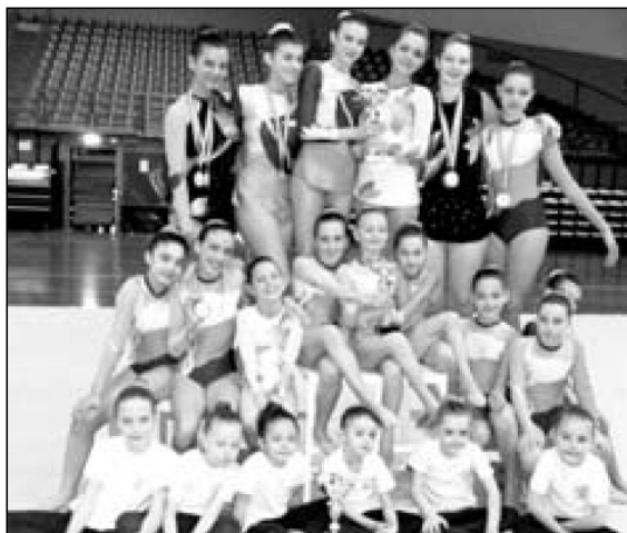
La squadra Asd di Oleggio

Le ginnaste della Asd Ginnastica Oleggio iniziano a vincere fin da piccole