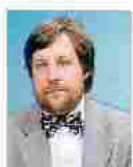
Luca Mercalli Meteorologo e volto tv, fa parte del gruppo

Il gruppo che farà da consulente al Comune di Torino lavora già per l'Unione montana Valsusa, e altri Comuni, tra cui Rivalta, di cui Montanari è stato assessore fino allo scorso giugno