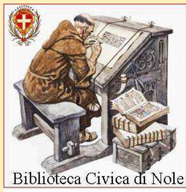
Biblioteca Civica di Nole