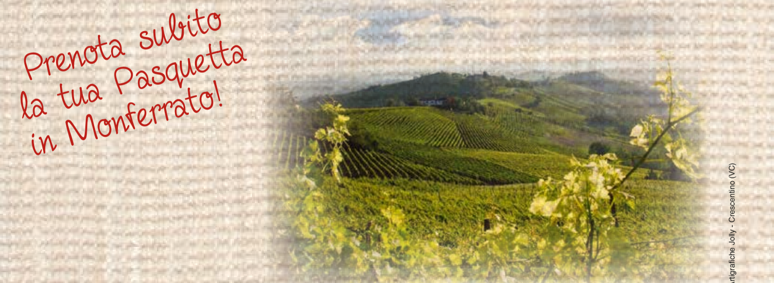
Artigrafiche Jolly - Crescentino (VC)

Prenota subito la tua Pasquetta in Monferrato!