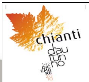
Esempio nr. 2