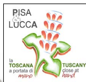
Esempio nr. 3

Per riuscire ad ottenere il logo voluto potrebbero essere attivati concorsi aperti alle scuole o a professionisti, ovviamente il tutto gratuitamente. Rimane di fondamentale importanza la scelta accurata del logo che dovrà essere utilizzato in tutto il progetto, dalla cartellonistica alla carta intestata o alla riconoscibilità sui manifesti.