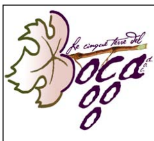
Esempio nr. 1