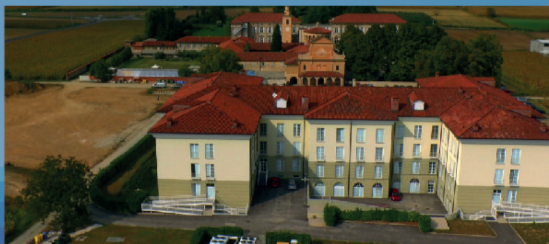
SANTUARIO BEATA VERGINE DEL TROMPONE Moncrivello (VC)